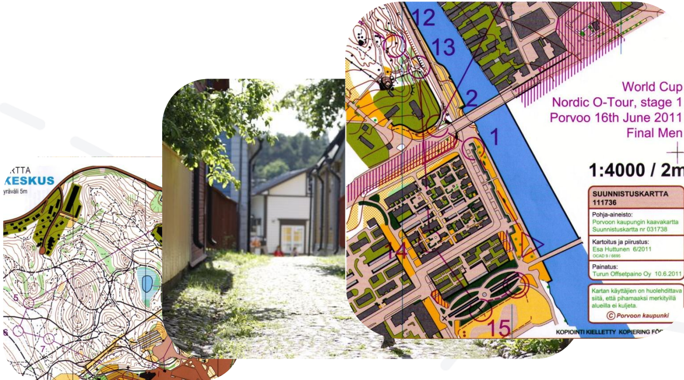
Kartta ja kuvat: LS-37 (2000) ja OK Orient (2011)