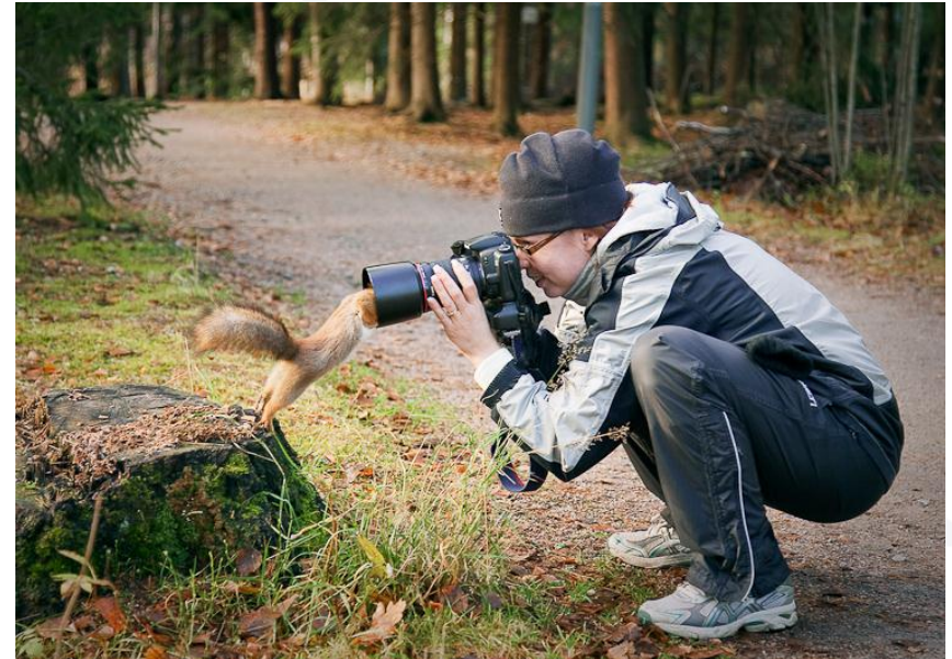
Kuva: Vesa – Pekka Heikkinen; 2010 luontokuva ”Luonto ja Ihminen” www.Luontokuva.fi