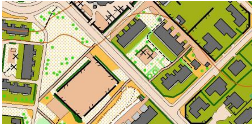
Kuva: Harjoituskartta TH 2011